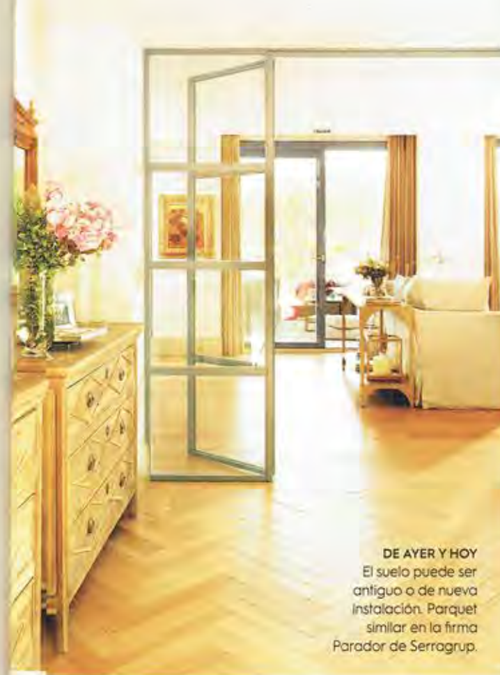
DE AYER Y HOY El suelo puede ser antiguo o de nueva instalación. Parquet similar en la firma Parador de Serragrúp.

Fáciles de instalar Su escaso grosor (de 6 a 12 mm) permite instalarlos con un sencillo sistema 'clic'. Económicos, pero... Con un precio a partir de 15 €/m 2 + instalación (10 €/m 2 ) es importante fijarse en su clasificación de resistencia a la abrasión, ya que no admiten restauraciones.