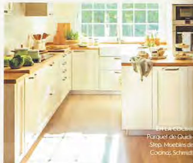
EN LA COCINA Parquet de Quick-Step. Muebles de Cocinas Schmidt

Más integrado Poner la misma madera en el baño que en el resto de casa le da un aspecto diáfano y más grande.