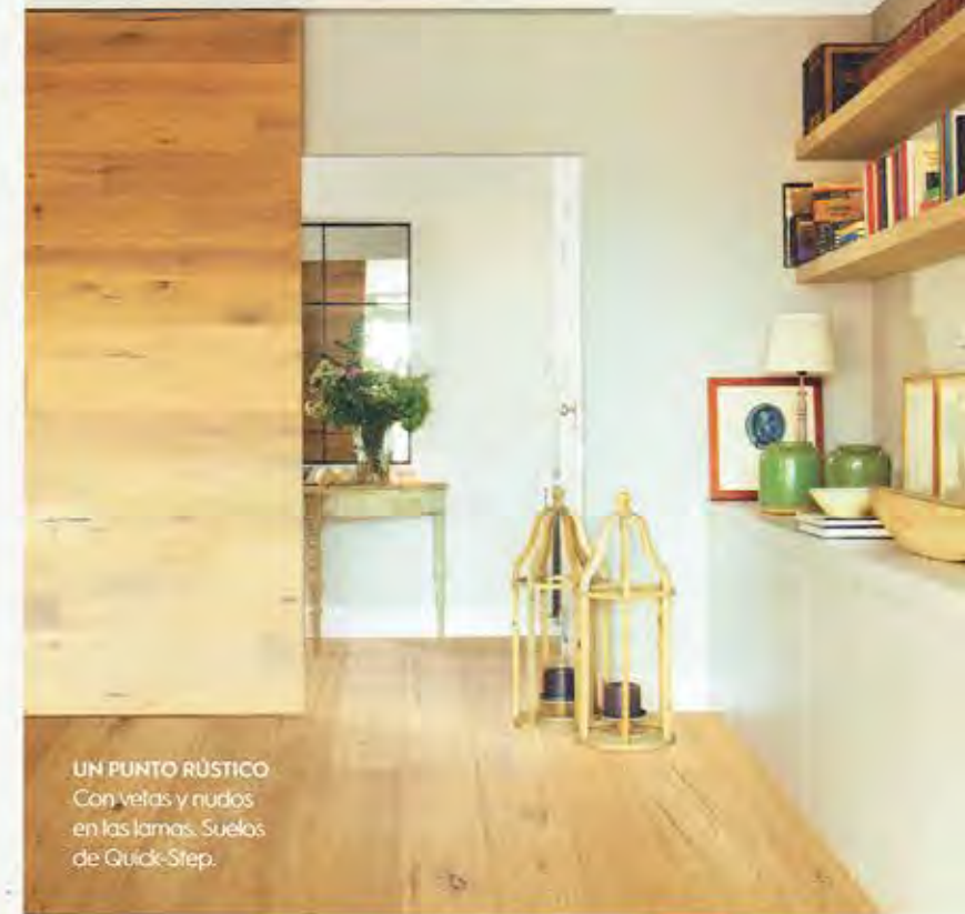
UN PUNTO RÚSTICO Con vetas y nudos en las laminas. Suelos de Quick-Step.

UNA NUEVA VIDA El parquet puede ser para toda la vida y esta casa centenaria lo demuestra: sus suelos se recuperaron y los volvieron a colocar.