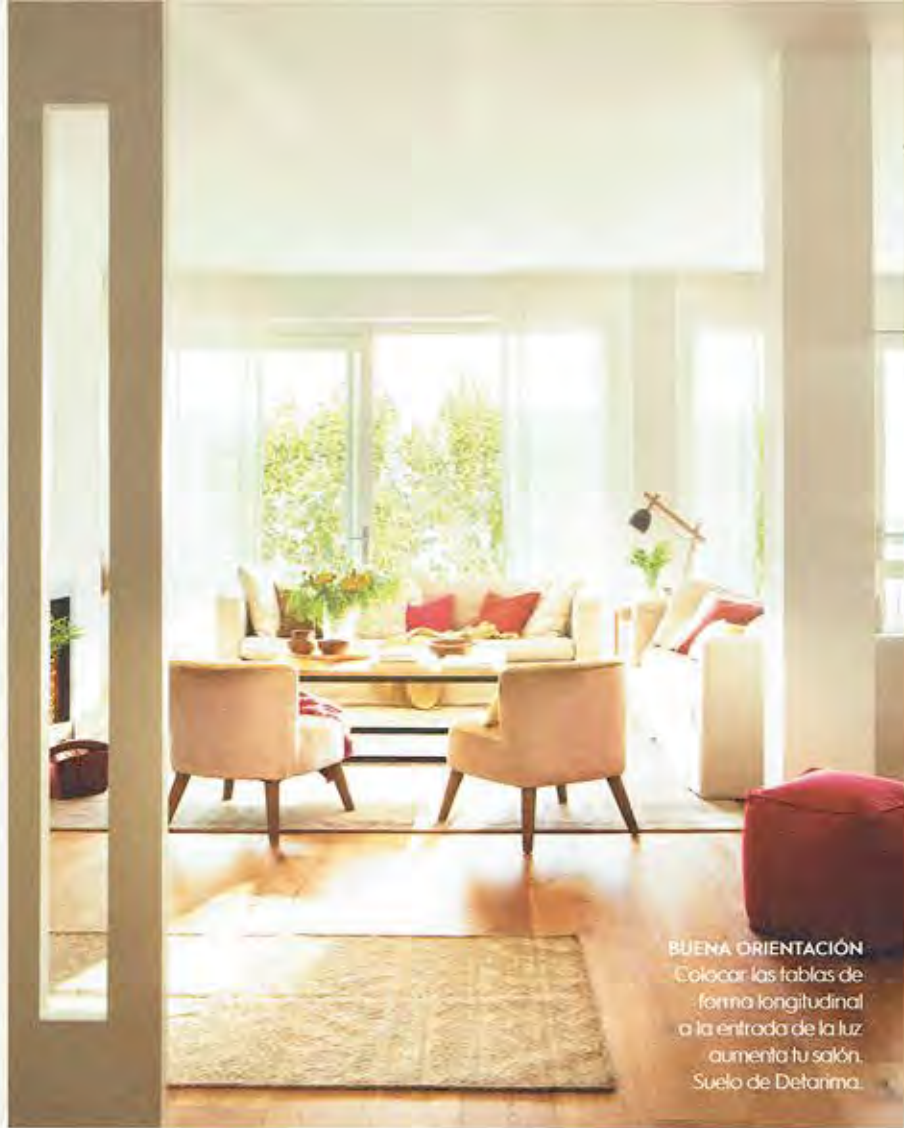
BUENA ORIENTACIÓN Colocar las tablas de forma longitudinal a la entrada de la luz aumenta tu salón. Suelo de Detarima.