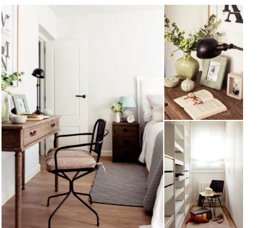
La redistribución de la planta ha permitido crear un cuarto multiusos y un dormitorio principal

gro de Amadeus, colocada sobre una alfombra realizada a medida de MA Salgueiro. Completan la estancia una estantería, mesitas auxiliares, pufs de ratón, lámparas, cuadros y figuras de Amadeus y Bazar. Los detalles decorativos son de Zara Home y Kenay Home. DORMITORIO Y BAÑO La redistribución de la planta ha permitido crear un cuarto multiusos y un dormitorio principal. Este último incorpora ahora un pequeño vestidor, funcional y luminoso, con armario a medida de Midi. En el dormitorio destacan el cabecero y las mesillas de noche de Maison du Monde, sobre las que reposan sendas lámparas de piedra con panta-