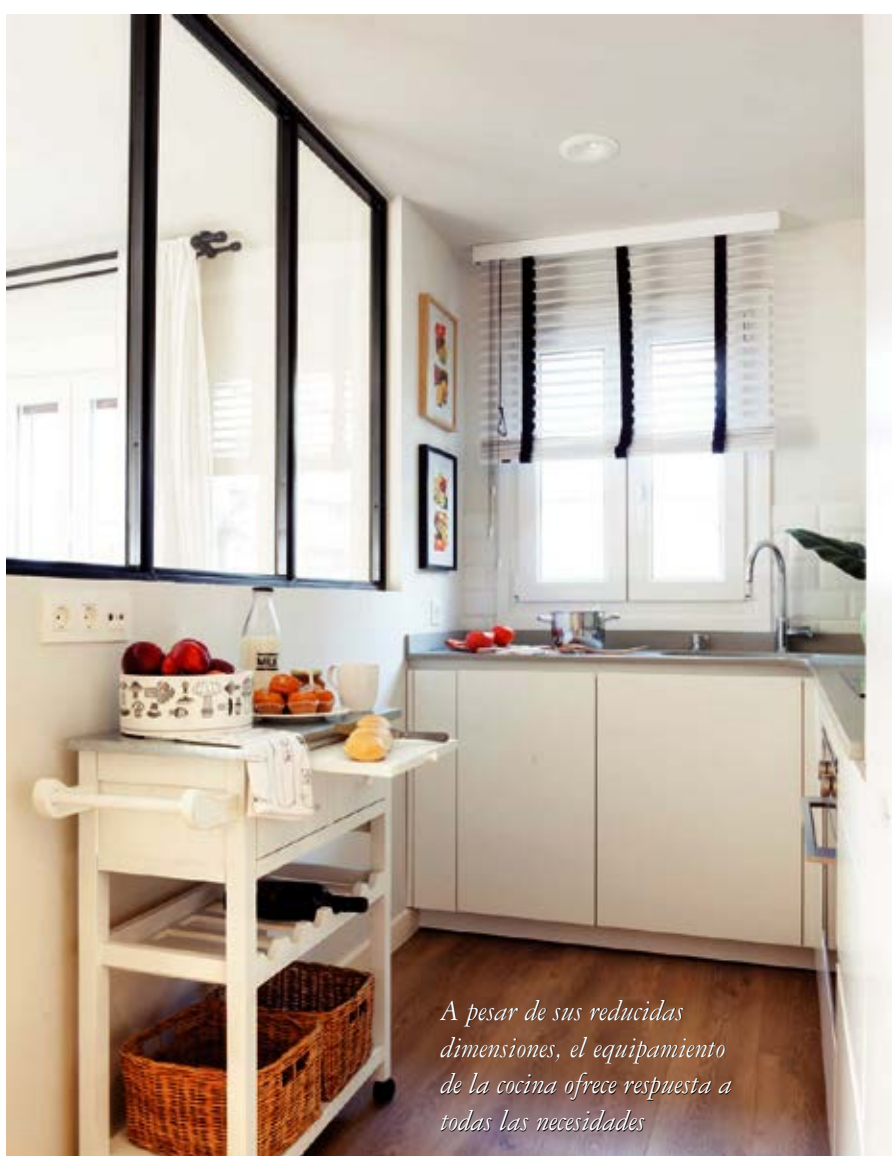
A pesar de sus reducidas dimensiones, el equipamiento de la cocina ofrece respuesta a todas las necesidades.