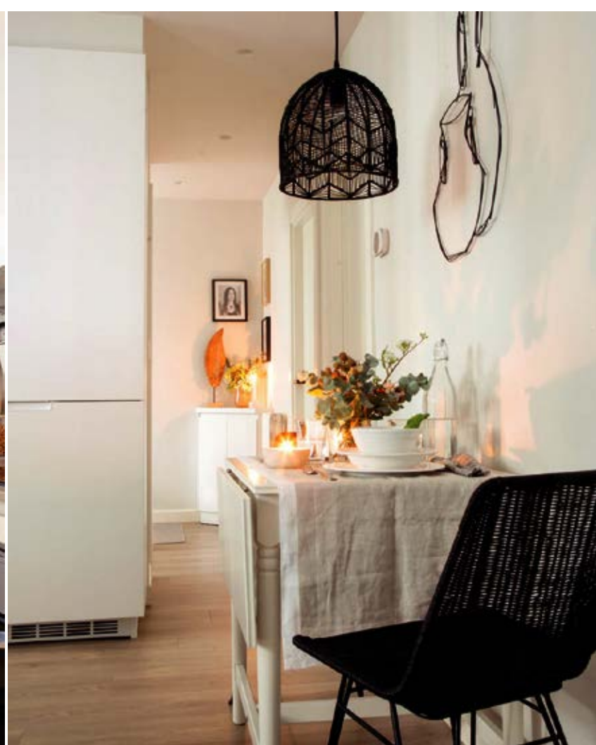
EN SOLO 50 M 2 ESTE ANTIGUO PISO, CONSTRUIDO PARA LOS TRABAJADORES DE UNA VIEJA FÁBRICA, SE TRANSFORMA EN UNA VIVIENDA ACTUAL, CÁLIDA Y FEMENINA, TAL COMO HUBIERA DESEADO SU JOVEN PROPIETARIA.