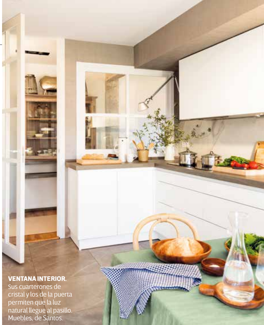
VENTANA INTERIOR. Sus cuarterones de cristal y los de la puerta permiten que la luz natural llegue al pasillo. Muebles, de Santos.