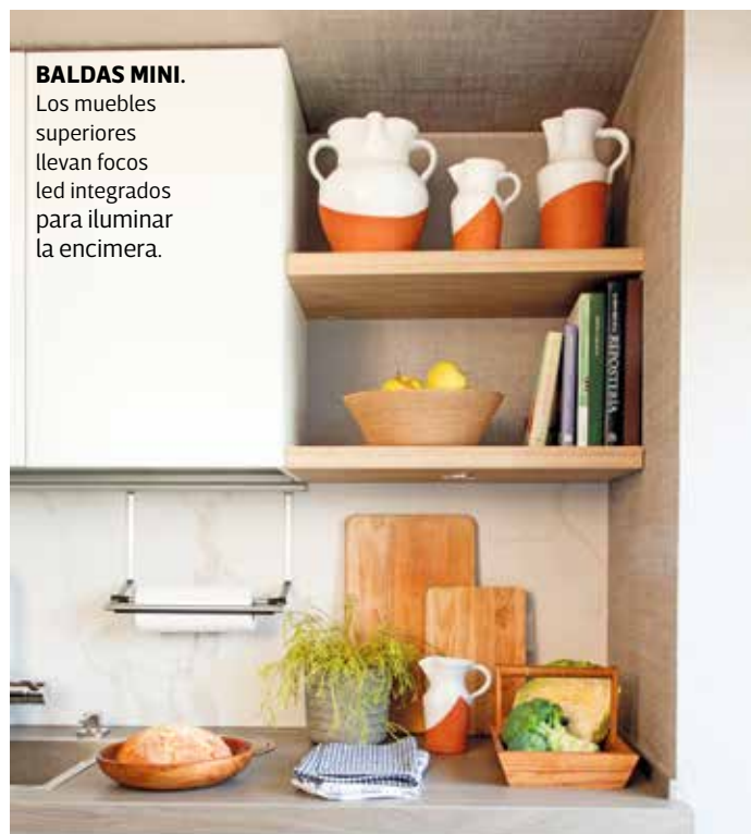
BALDAS MINI. Los muebles superiores llevan focos led integrados para iluminar la encimera.

Al eliminar el antiguo tabique del pasillo, el salón ha crecido en metros. La cocina también lo ha hecho al integrar el antiguo tendedero y arañar unos centímetros al salón. El piso cuenta además con un dormitorio con armario y zapatero y baño con ducha.