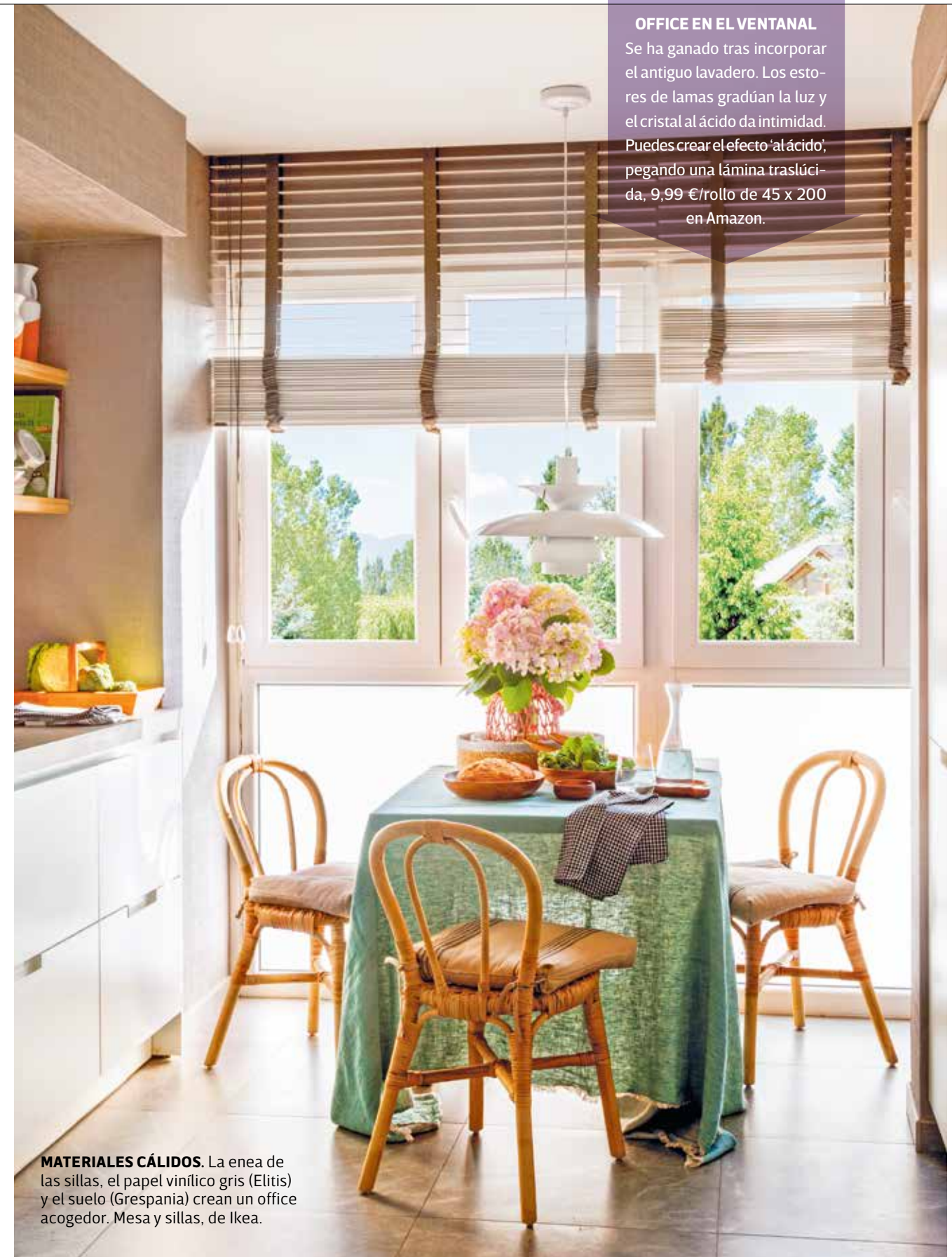
MATERIALES CÁLIDOS. La enea de las sillas, el papel vinílico gris (Elitis) y el suelo (Grespania) crean un office acogedor. Mesa y sillas, de Ikea.

Se ha ganado tras incorporar el antiguo lavadero. Los estores de lamas gradúan la luz y el cristal al ácido da intimidad. Puedes crear el efecto ‘al ácido’, pegando una lámina traslúcida, 9,99 €/rollo de 45 x 200 en Amazon.