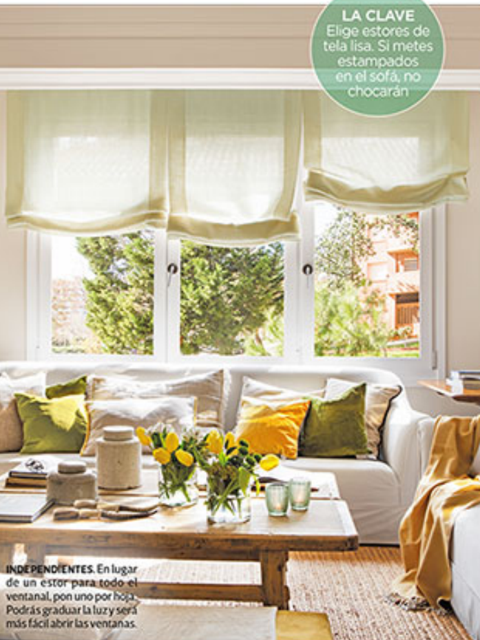
INDEPENDIENTES. En lugar de un estor para todo el ventanal, pon uno por hoja. Podrás graduar la luz y será más fácil abrir las ventanas.