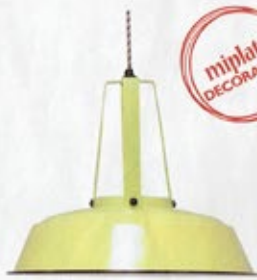
AMARILLO NEÓN Lámpara de metal de HK Living, de venta en Car Möbel (126 €).