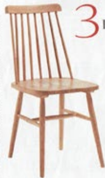
EL TOQUE NÓRDICO Silla Country, en madera de roble, de La Oca (125 €).