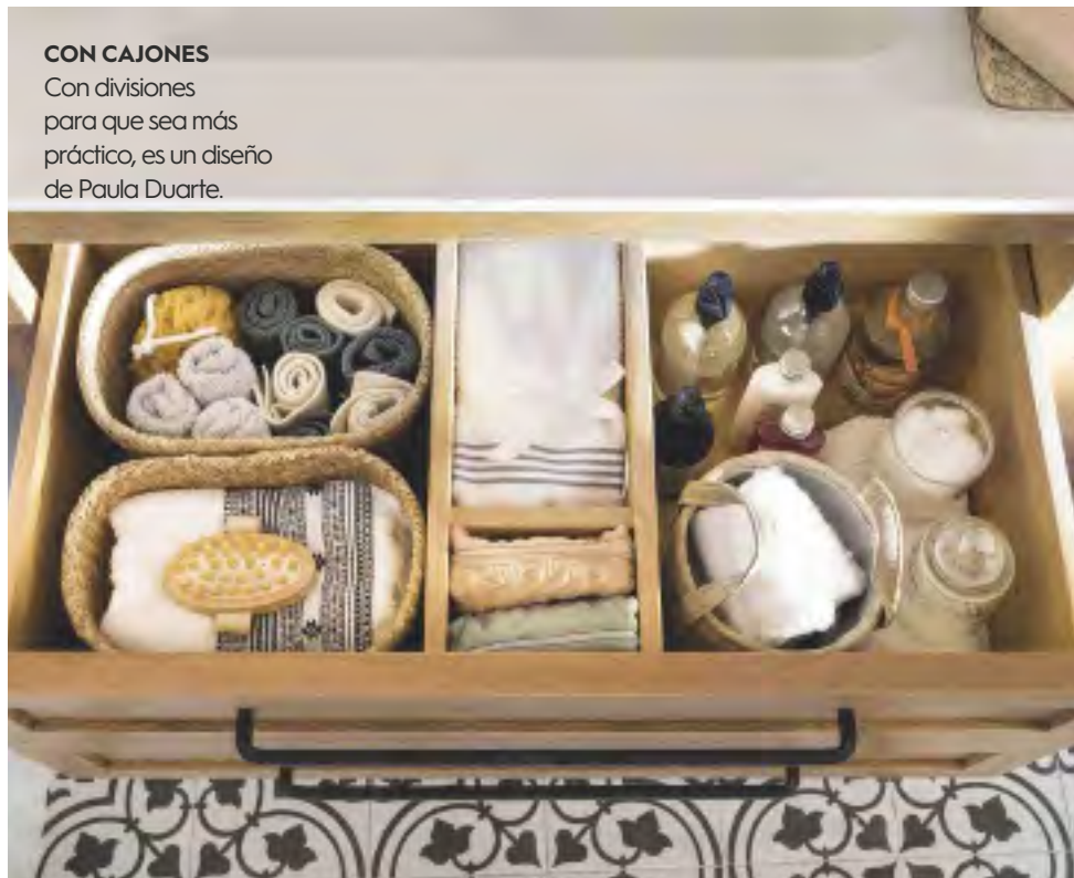
CON CAJONES Con divisiones para que sea más práctico, es un diseño de Paula Duarte.