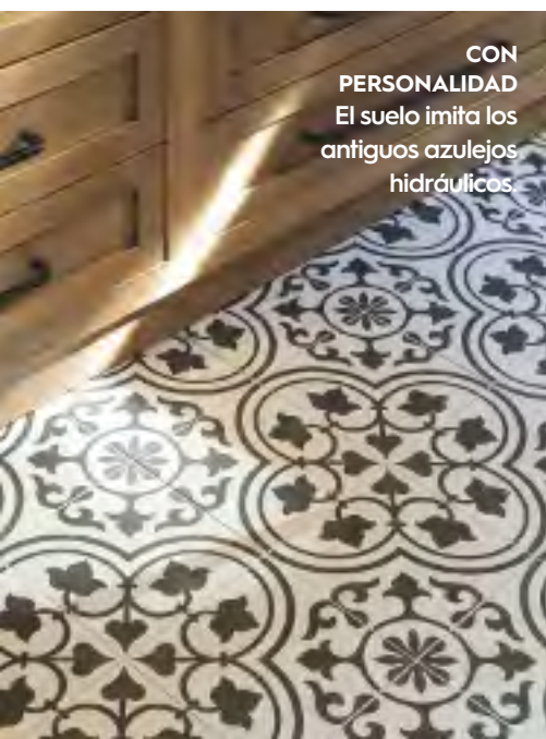
CON PERSONALIDAD El suelo imita los antiguos azulejos hidráulicos.