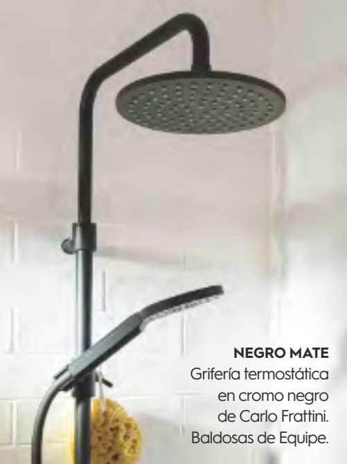
NEGRO MATE Grifería termostática en cromo negro de Carlo Frattini. Baldosas de Equipe.