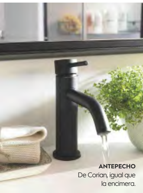
ANTEPECHO De Corian, igual que la encimera.